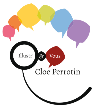
Illustration en relief : Jeu d'ombres et de lumières avec un camaïeu de couleur sur le site cloe-perrotin.com